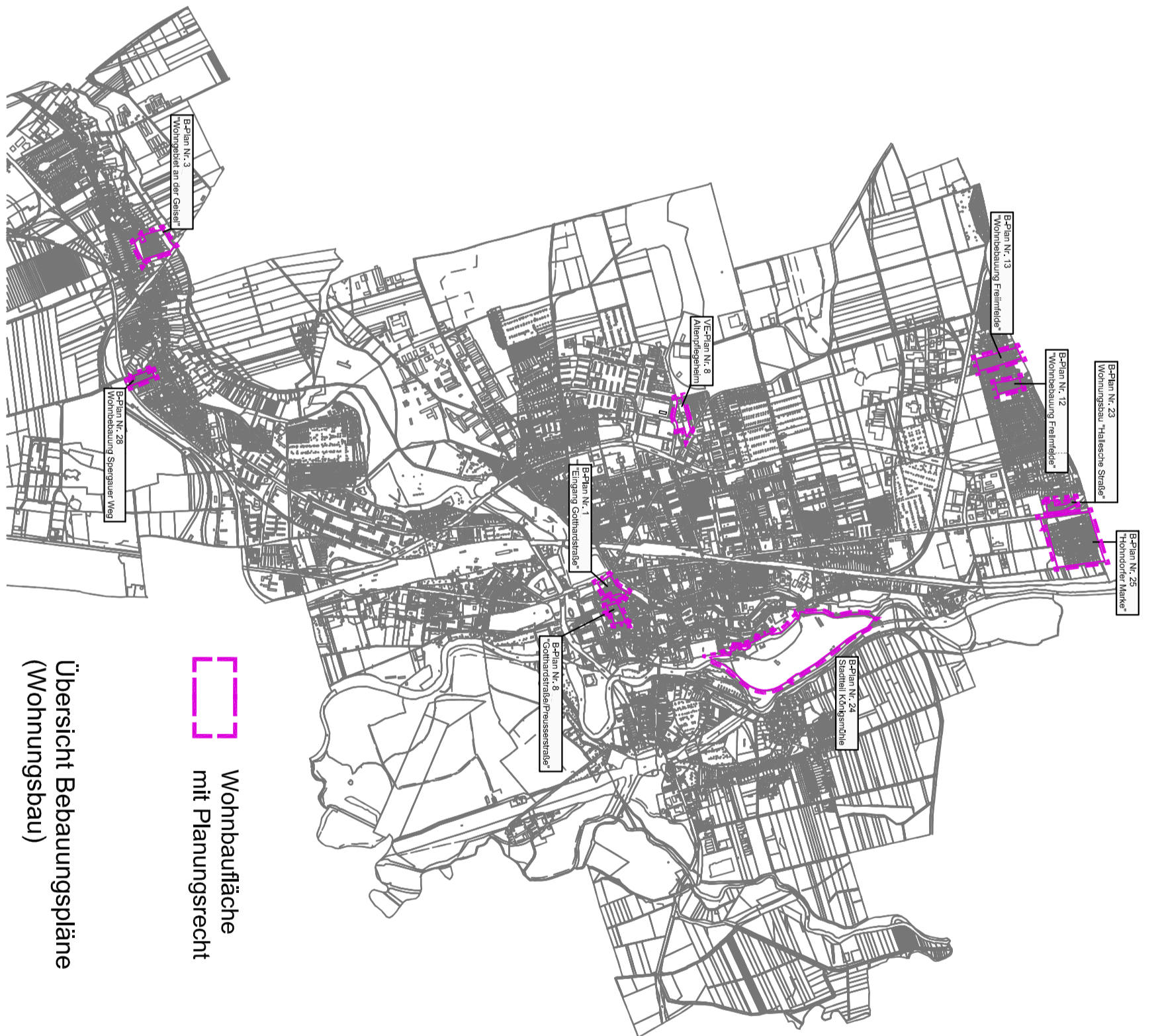
Wohnbaufläche mit Planungsrecht Übersicht Bebauungspläne (Wohnungsbau)